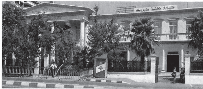
مبنى المحكمة العسكرية.